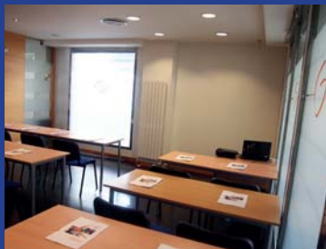
Sala de Formación